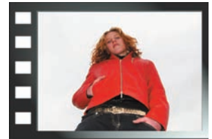
Contre plongée verticale