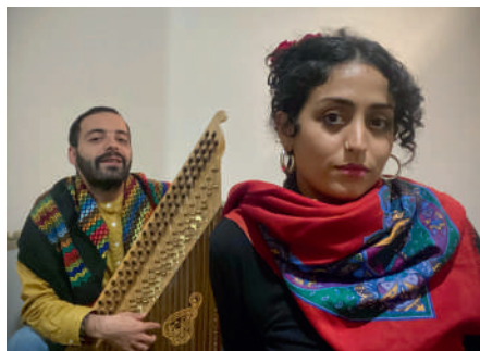
Les Cousins