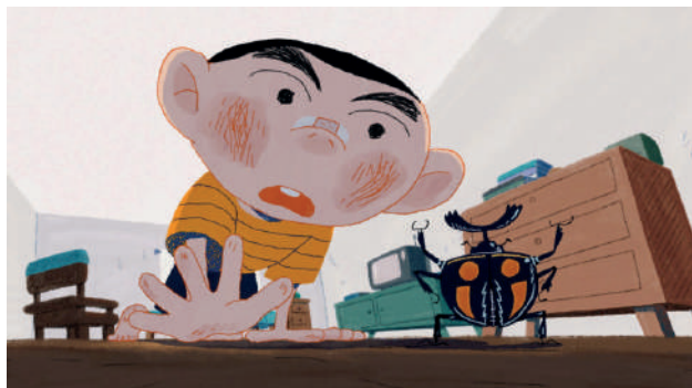
Drôles de rencontres