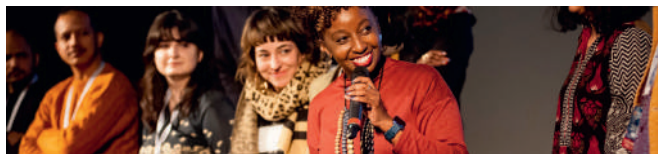
Produire au Sud - Pitch 2023