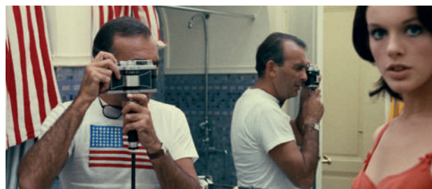
Deux ou trois choses que je sais d'elle