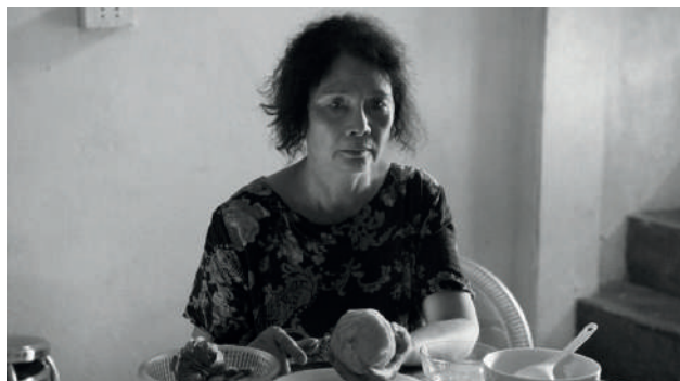
Cu Li ne pleure jamais