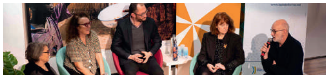
Rencontres professionnelle 2023

Accès libre et gratuit dans la limite des places disponibles