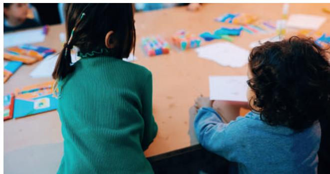
Atelier © Margaux Martins