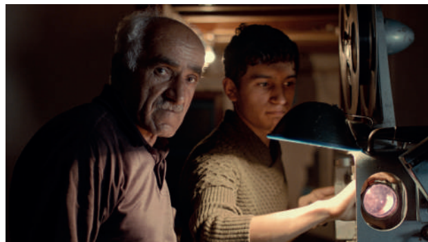
Le Retour du projectionniste