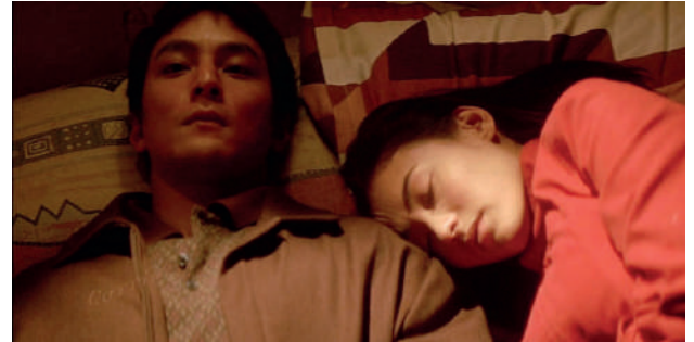
Une nuit à Mongkok