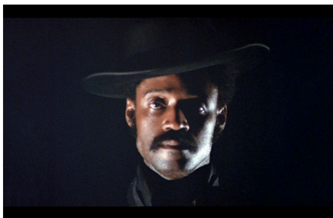
Sweet Sweetback's Baadasssss Song, Melvin Van Peebles, 1971