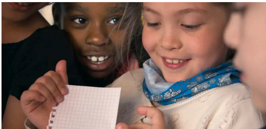
Apprendre, Claire Simon, 2024

Le cinéma français n'a cessé de tourner autour de ces problématiques depuis près de trente ans. Et il faudrait être atteint de cécité pour ne pas voir poindre sous l'appellation générique et floue de « films de banlieue », dont La Haine (1995) fut l'étendard, le déploiement inédit d'une multitude de formes et d'esthétiques qui traduisent combien le jeune cinéma français a été littéralement travaillé au corps, traversé et d'une certaine manière revitalisé par la nécessité de faire exister sans démagogie ceux que nous sommes (...)