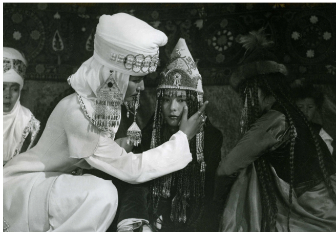
Le Descendant du léopard des neiges, Tolomouch Okeev, 1983