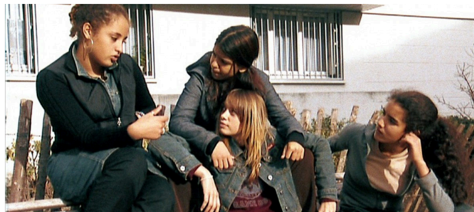
L'esquive, Abdellatif Kechiche, 2004

Aussi bien que la nation ne se décrète pas (Rousseau comme Renan s'accorderaient parmi d'autres sur ce point), le rassemblement humain qui fait un pays n'est jamais totalement prévisible ni programmable. Et puis jamais nous n'abrogerons ni la diversité des langues, ni les pratiques culturelles ou coutumières (que la loi permet de réguler dans les cas où elles enfreignent à la chose publique), ni n'effaçons la diversité des couleurs ou des types physiques où s'incarnent si complètement notre humanité. Pour le reste, nous sommes le sujet de nos actions : que faisons-nous, individuellement et collectivement, de ce qui nous a fait ? C'est moins une culture ou l'éloge de la différence (différents nous le sommes toutes et tous) que celle du commun qu'il nous faut penser et réinventer depuis là où nous sommes dans ce lieu du monde qui est le nôtre.