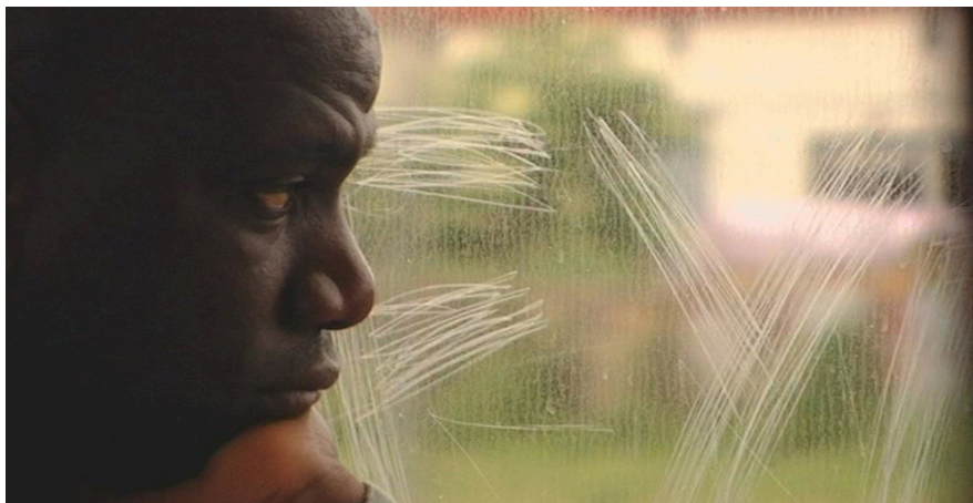
La Mort de Danton, Alice Diop, 2011